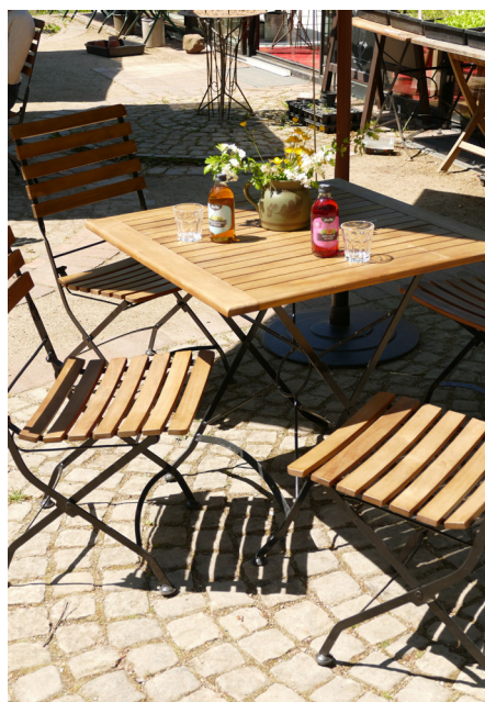
Loheland Laden & Café

Liebe Gäste, wir freuen uns sehr, Sie ab sofort wieder im Loheland Laden & Café begrüßen zu dürfen.