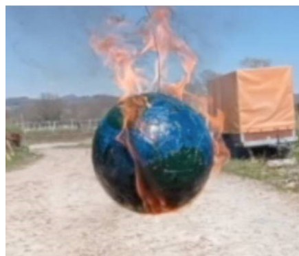
„Die Welt steht Kopf“ - und manchmal brennt sie auch (Standbild aus der Live-Performance)

falsch zu erfassen, sondern mit eindeutig - nicht eindeutig . Dadurch hat es die 8a geschafft, ihre Fragen und Anliegen immer präziser herauszuarbeiten.