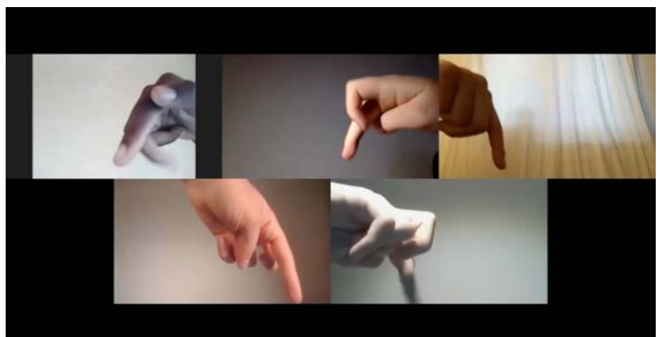
Fingerspiel aus der Live-Performance

Glückwunsch an die Klasse 8a. Alles in allem – und gerade auf künstlerischer Ebene – ein rundum gelungenes Projekt! Grandios!