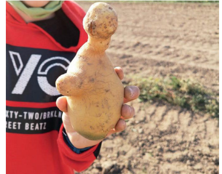
Für den Titel der sonderbarsten Kartoffel war dieses Exemplar der Favorit