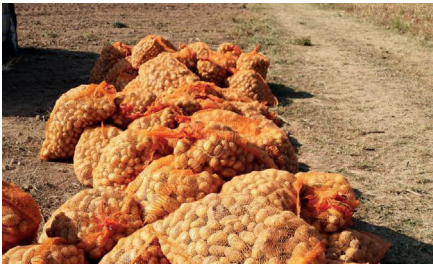
Ein Haufen voll Kartoffeln, den die Schülerinnen und Schüler gesammelt haben